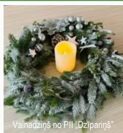
Vainadziņš no PII „Dzīpariņš”

(Svētku fotomirkļi un aktivitātes – no 6. līdz 11. lpp.)