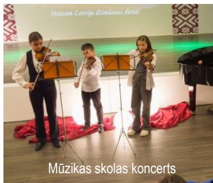
Mūzikas skolas koncerts