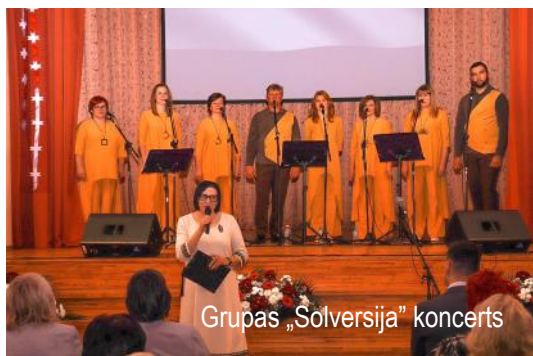
Grupās „Solversija” koncerts