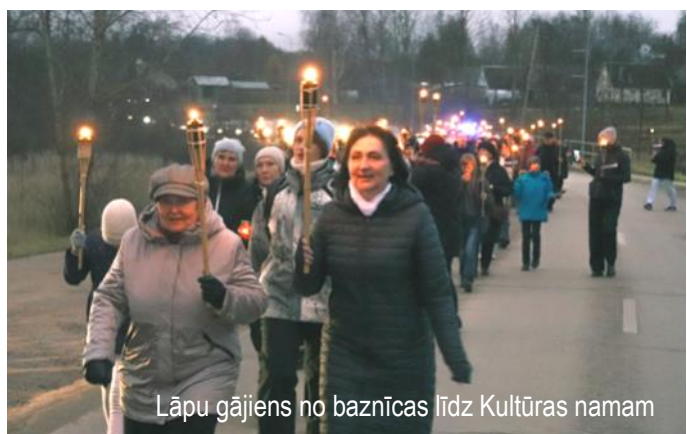
Lāpu gājiens no baznīcas līdz Kultūras namam