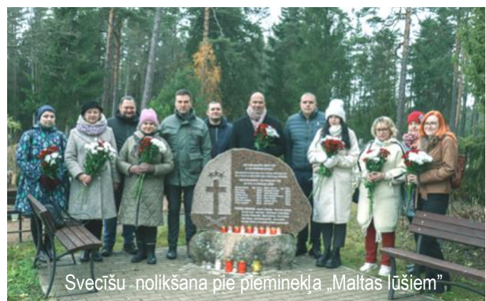
Svecīšu nolikšana pie pieminekļa „Maltas lūšiem”