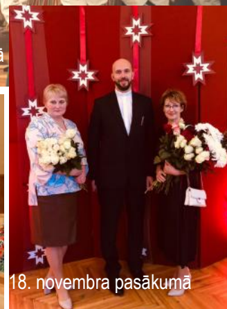
18. novembra pasākumā