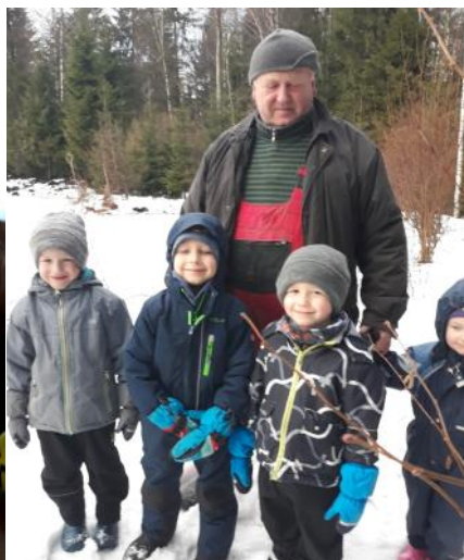
Ceļā pēc eglītes ar dzedu