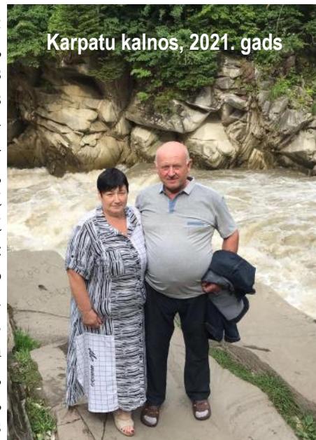
Karpatu kalnos, 2021. gads

Daktere ir tradicionālo ukraiņu ēdienu, jo īpaši vareņiku meistarē un saka, ka pa nedēļu ar vīru atpūšas (kā tādi robotiņi katrs iet savos darbos), bet piektdienās esot tas īpašais satraukums un gaidas. Katram mazbērnam garšo savi vareņiki: vienam ar biežpienu, citam ar gaļu, mazmeitiņai – bez nekā.