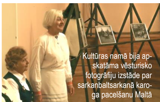
Kultūras namā bija apskatāma vēsturisko fotogrāfiju izstāde par sarkanbaltsarkanā karoga pacelšanu Maltā