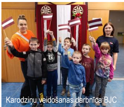
Karodziņu veidošanas darbnīca BJC