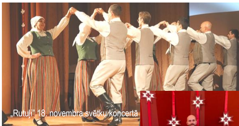
„Rutuli” 18. novembra svētku koncertā