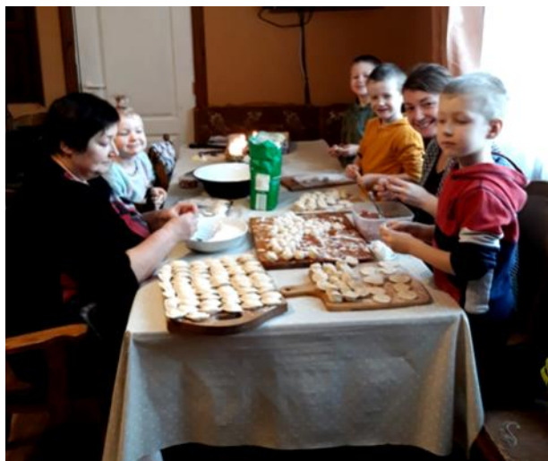
Kādā svētdienā ar babu, veidojot vareņikus