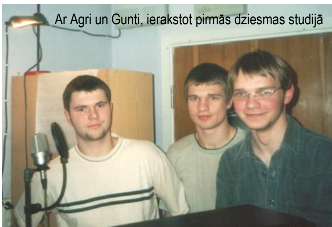
Ar Agri un Gunti, ierakstot pirmās dziesmas studijā