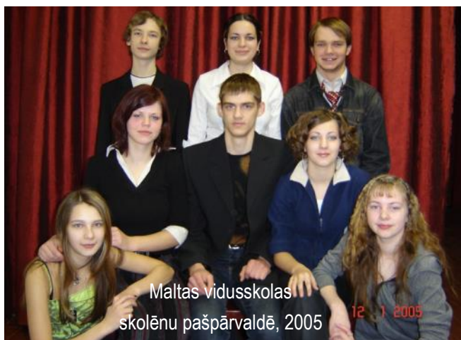
Maltas vidusskolas skolēnu pašpārvaldē, 2005