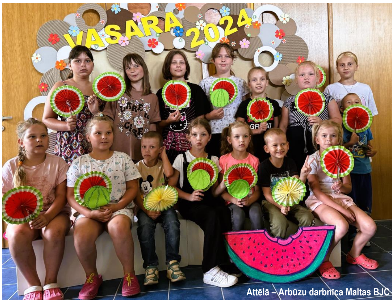
Attēlā – Arbūzu darbnīca Maltas BJC