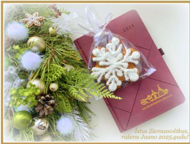
Istus Ziemassvētkus, raženu Jauno 2025.gadu!

Balts vai mazāk sniegots, bet decembris katru gadu nāk ar īpašām pārdomām un gaidām.