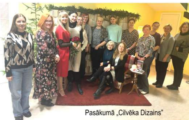
Pasākumā „Cilvēka Dizains”