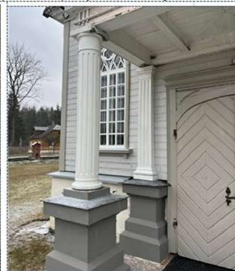
Kolonnas pirms (no kreisās) un pēc restaurācijas