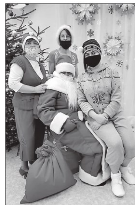
«Atmiņu DZĪPARIŅŠ. Pirmsskolas izglītība Maltā» ar atmiņu apkopojumu un dažādu laiku bildēm, kā arī jautri atgādājumi no bērnodrāzā ikdienas. Svētki aizvadīti klusā – kolektīvā gaisotnē, bet atmiņu iemūžināšanu plānots turpināt.