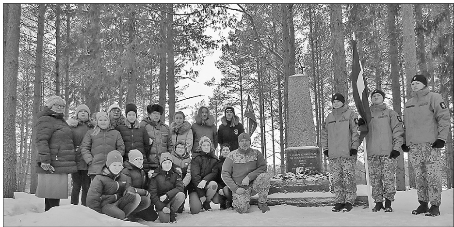
Pasākumā Rušenīcā pie 3. Jelgavas kājnieku pulka piemiņas obelīskā

(Sagatavoja Silvija Pīgožne. Informācijas avoti: Maltas pagasts pētījumos un atmiņās//A. Dzenis. 1. daļa 5. nodaļa. – Malta, 2018, 60. lpp.; Latvijas atbrīvošanas kara vēsture. 2.sēj. – R., 1938.; Juris Ciganovs. Latvijas neatkarības karš. 1918–1920.)