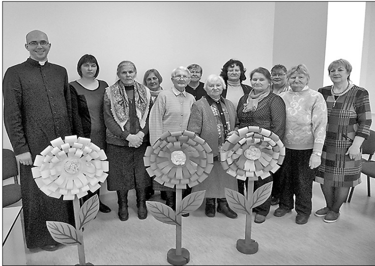
Manijas Tilsovas foto