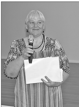
Grāmatu svētku «krustmāte» – rakstniece Biruta Eglīte