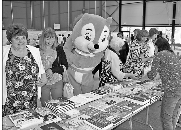
Grāmatu komercizstāde pulcēja dažādas lasāmvielas cienītājus