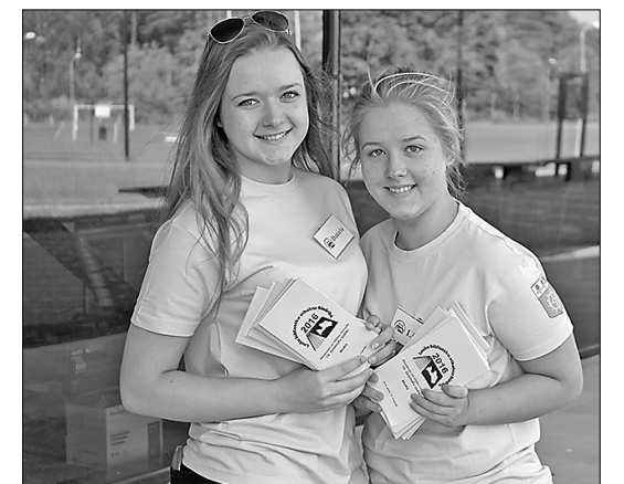
Brīvprātīgās Daniela Lozda un Līgta Krūza gādāja, lai katram apmeklētājam būtu svētku programma

Ērikas Grigorjevas paraksti zem foto.