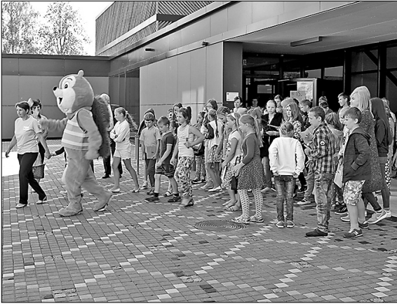
Pie Maltas pērles – daudzfunkcionālā centra. Vāverēns Toms ar bērniem dodas uz aktivitātēm Maltas Bēnu un jauniešu centrā