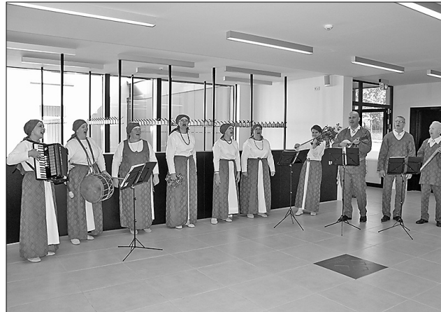
Kapela «Malta» sagaidīja Grāmatu svētku viesus ar skanīgām dziesmām