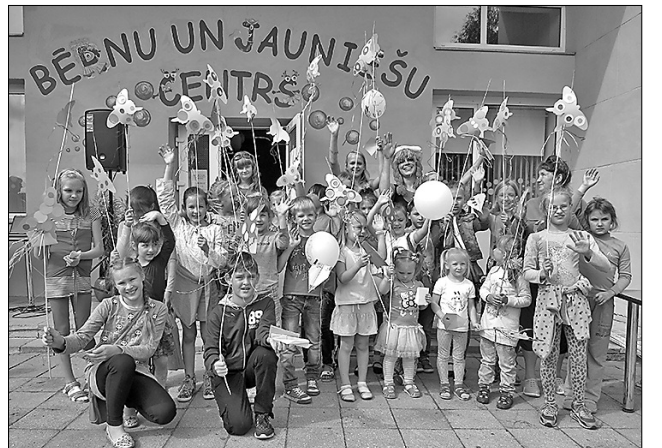
Maltas Bēnu un jauniešu centrā čakli pastrādāts dažādās radošajās darbnīcās