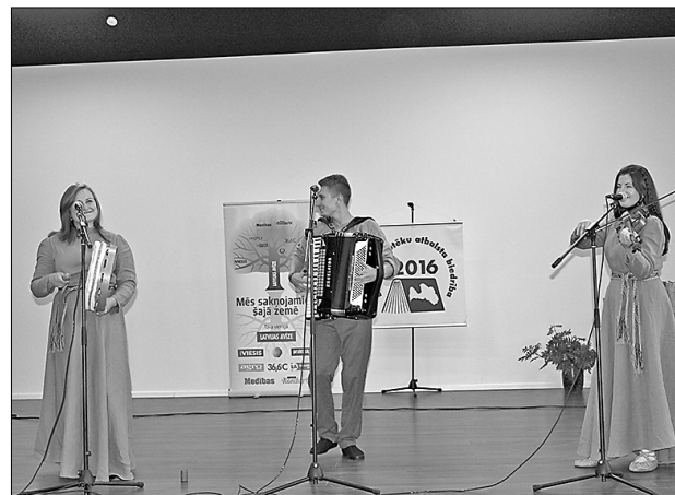
Latgaliešu postfolkloras grupa «Rikši» svētku noslēgumā sniedza daudz neaizmirstamu emociju