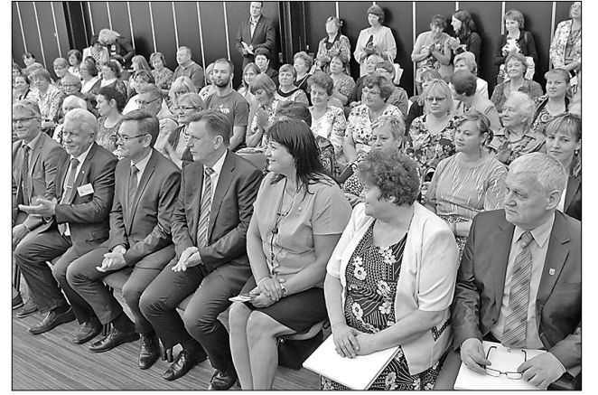
Grāmatu svētku atklāšanas koncertu apmeklēja gan Rēzeknes novada un Maltas pagasta vadība, gan Ministru prezidents Māris Kučinskis