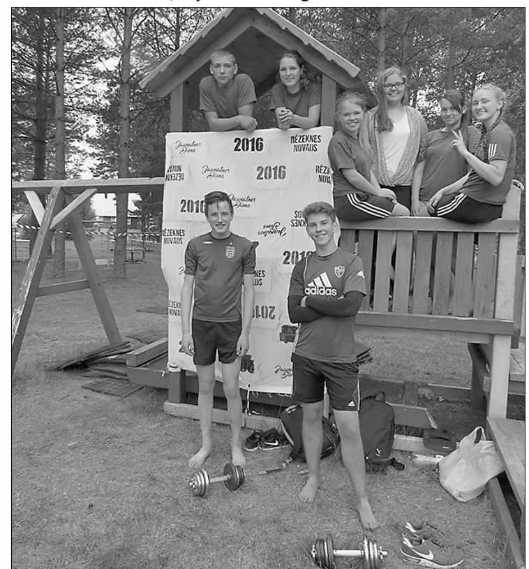
Maltas jaunieši – Rēzeknes novada Jaunatnes dienas komandas dalībnieki