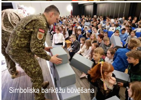
Simboliska barikāžu būvēšana