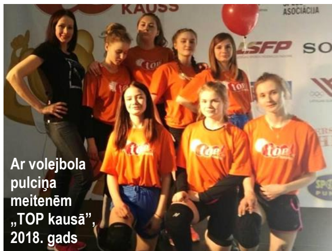
Ar volejbola pulciņa meitenēm „TOP kausā”, 2018. gads