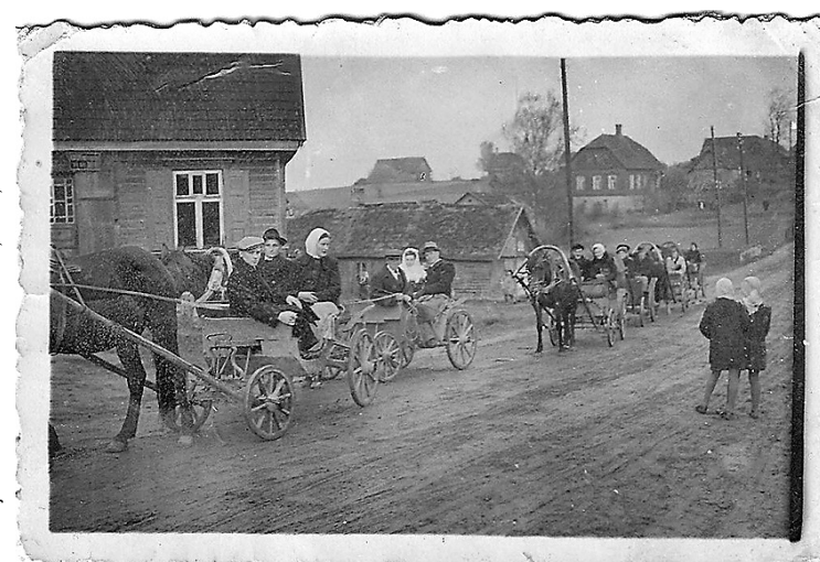
Publikācija izdevumā «Pašvaldību Dzīve», Nr. 29, 16.07.1937.

Ja nevēlaties šķirties no sev dārgām fotogrāfijām, varat atsūtīt arī ieskenētas bildes. Ja nav tādas iespējas, tad to varēs izdarīt uz vietas muzejā. Ja ir grūtības nokļūt līdz muzejam, dodiet ziņu, un risinājumu atradīsim. Protams, vērtīgas būs senās fotogrāfijas, bet arī nesenā pagātne un tagadne ir jau noticis vēstures posms, kuram nākotnē būs nozīme. Kāzas, bē-